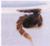
▲ Pupa del moscard tigre Pupa del mosquito tigre

El moscard tigre ( Aedes albopictus ) és originari del Sud-est asiàtic. L'estiu de 2012 es va detectar per primera vegada a Mallorca, on s'ha estès ampliament. El 2014 va arribar a Eivissa i el 2015 a Menorca.