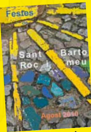
Segon premi Gustav Tilmann