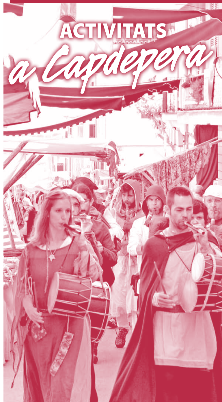
Depositi legal: PM 995-2010 PAPERECOLÒGIC (TECF) 100% LLIBRE DE CLOR fotoprintamunt.com

Capvespres: de dilluns a divendres de les 16h a les 20h.